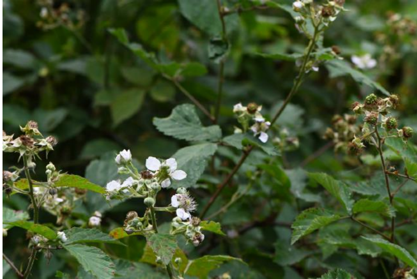
Braam. Foto Jan