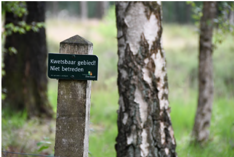
Kwetsbaar gebied!