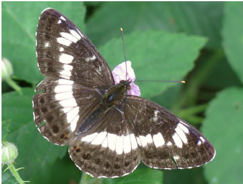
Kleine ijsvogelvlinder.