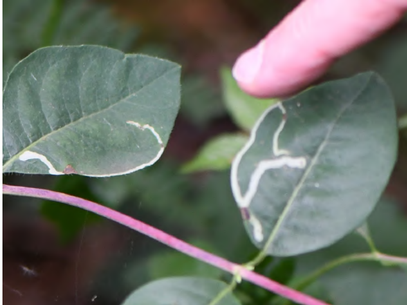
Mijnen op kamperfoelie ( Aulagromyza cornigera ?).