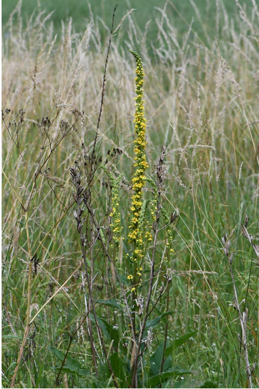
Zwarte toorts.