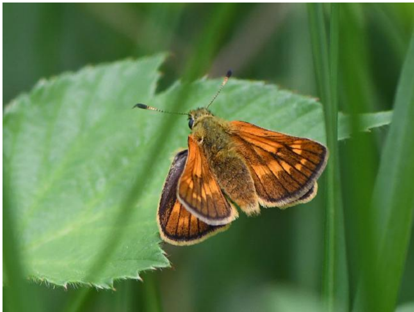
Groot dikkopje. Foto Jan