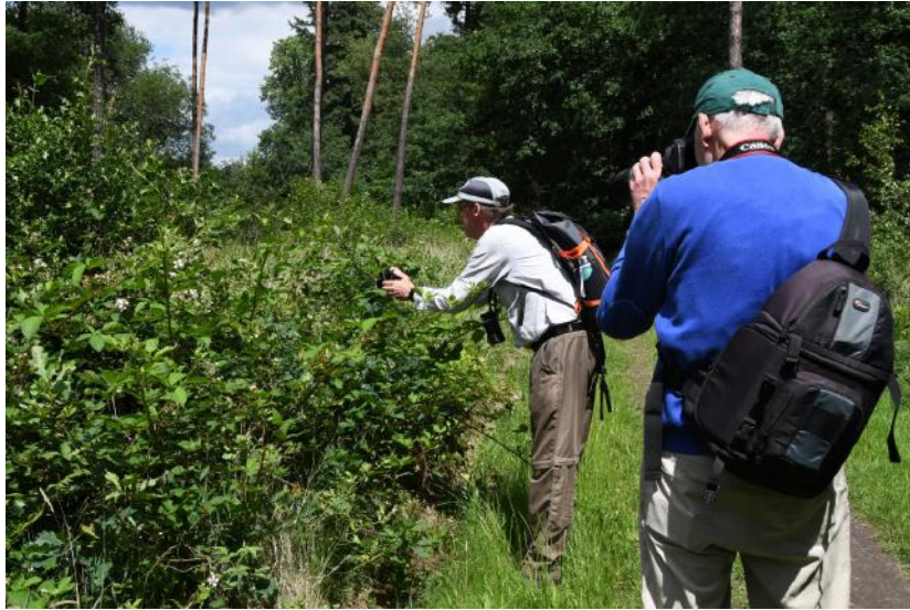
Excursie. Foto Jan