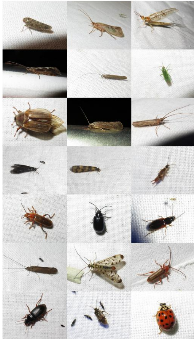
Andere beestjes.