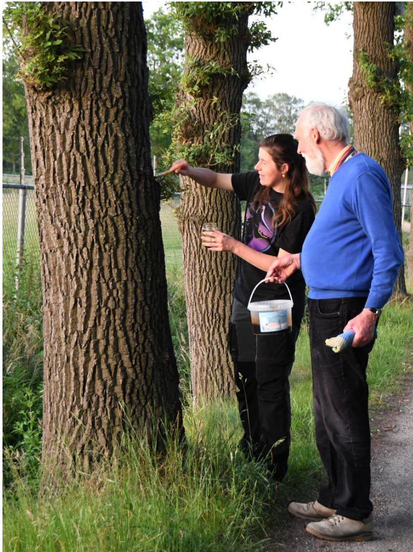
Aan het stropen.