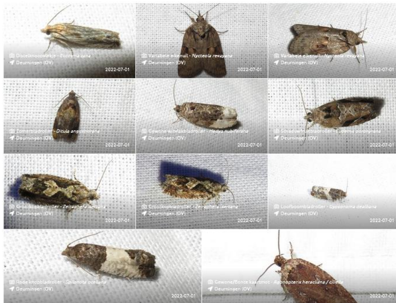
Beestjes 3.