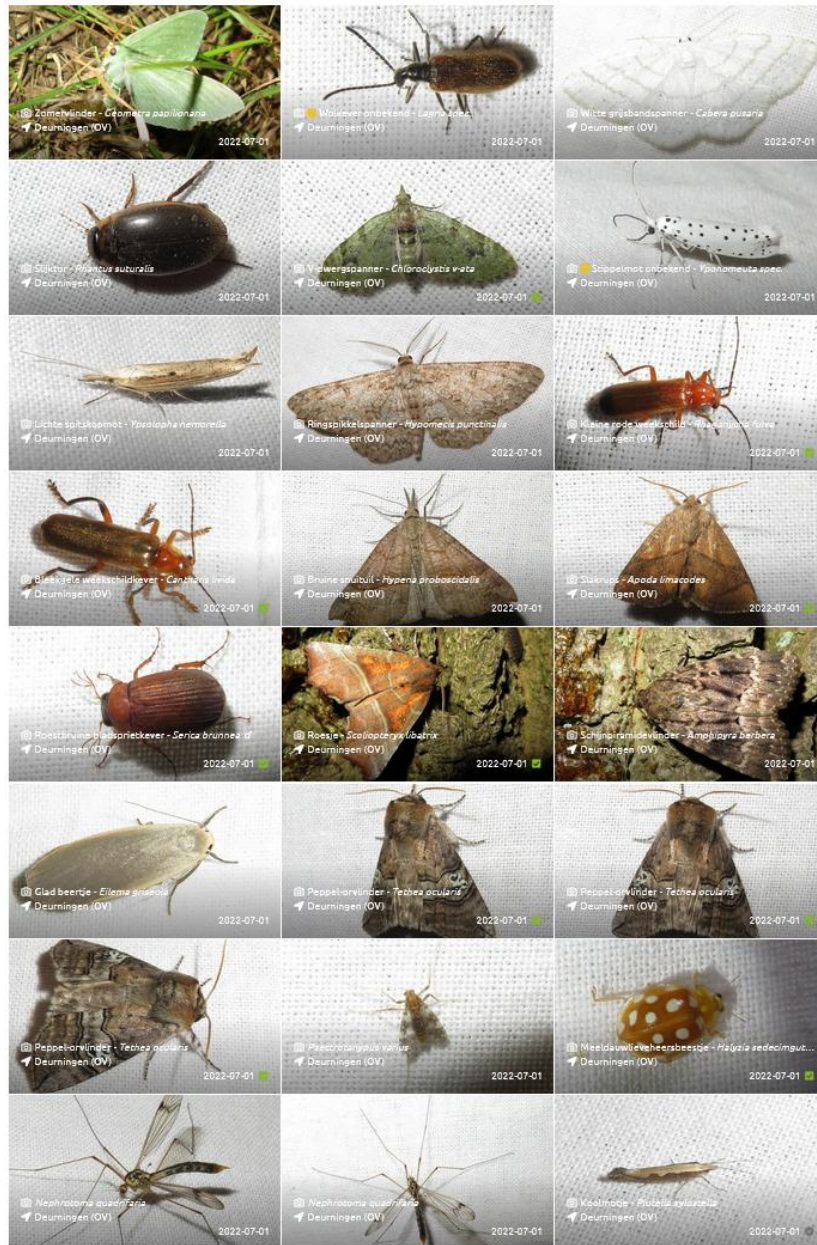
Beestjes 1. Foto's Wim