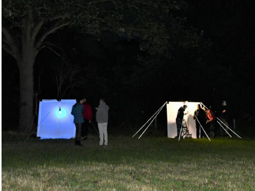
De lakens.