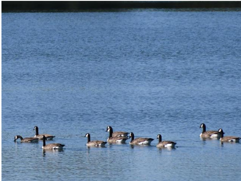
Canadese ganzen.