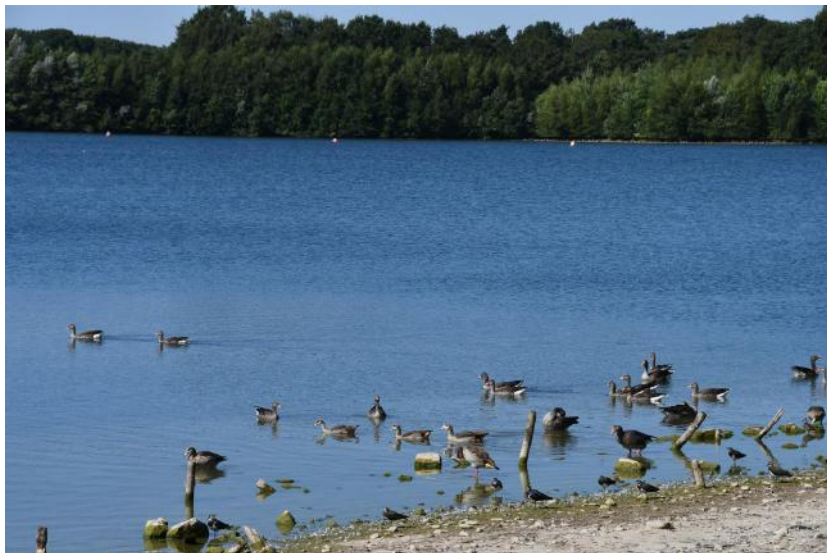
Oelemars met nijlgans, grauwe gans en kievit.