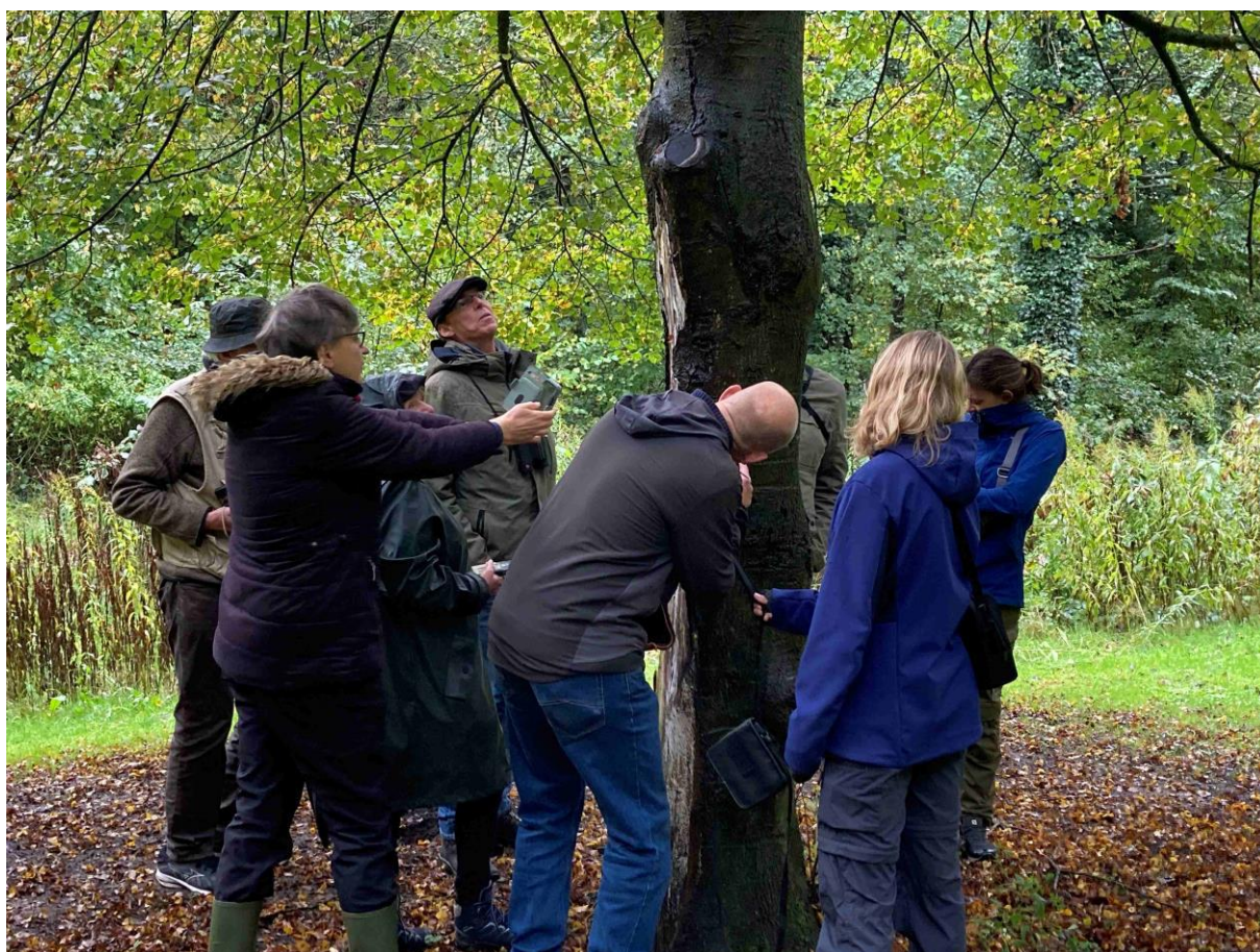
Foto gemaakt tijdens de excursie: Gallen en Mijnen (Ledeboerpark).